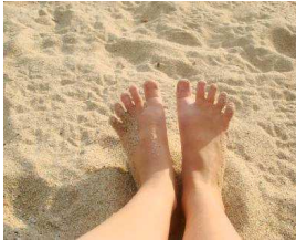
Démo : Doigts de pied en éventail

Nous profiterons du soleil, ferons des pâtés de sable, mettrons les pieds dans l'eau (voire plus), et boirons un bon verre de cidre ou de Muscadet (pensez à en appor-